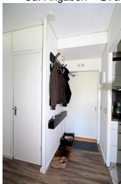
Flur mit AB