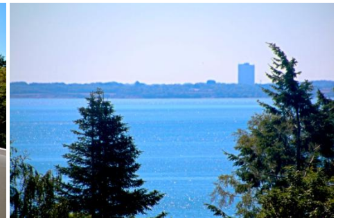
Loggia mit Seeblick