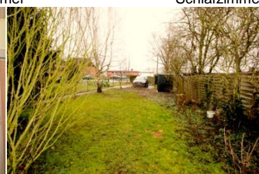
Blick zum Kfz-Stellplatz