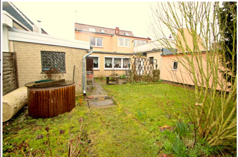
Garten und Terrasse