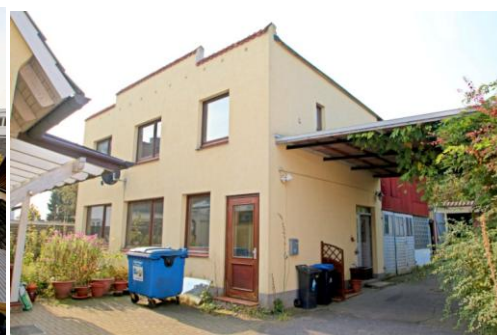
Werkstatt & Bürogebäude